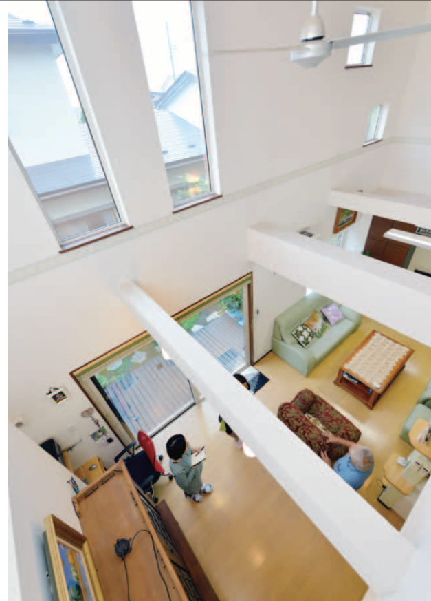
2階個室の窓からリビングを見下ろす。梁を残して吹き抜けにすることで、日中も照明が欠かせないほど暗かったというリビングが、明るく開放的な空間に

リフォーム費用 / 2,950万円 施工面積 ……197.8㎡(59.8坪) 施工箇所 ……全面 工事期間 ……4ヵ月 築年数 ……32年 種類 ……戸建て 家族構成 ……2人(夫婦+ねこ2匹)