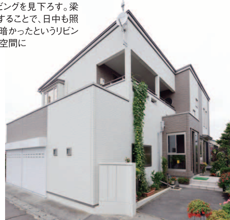
外観も明るさを重視。石を積み上げたような風合いのスタイリッシュな白壁を、ブラウンが引き締めている。壁材は「東レステージ」を採用