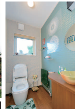
奥様がセレクトされた焼き物の手洗い器を手作りのカウンターに設置。グリーン×ホワイトのさわやかな色彩と、壁のアクセントとしてエコカラットも使用し、快適かつ遊び心のある空間になった