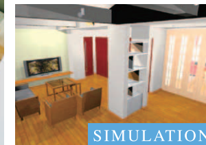
キッチンとリビングの仕切りは間仕切り折戸を使用。開閉しやすく、広々としたLDK感覚の住空間を実現