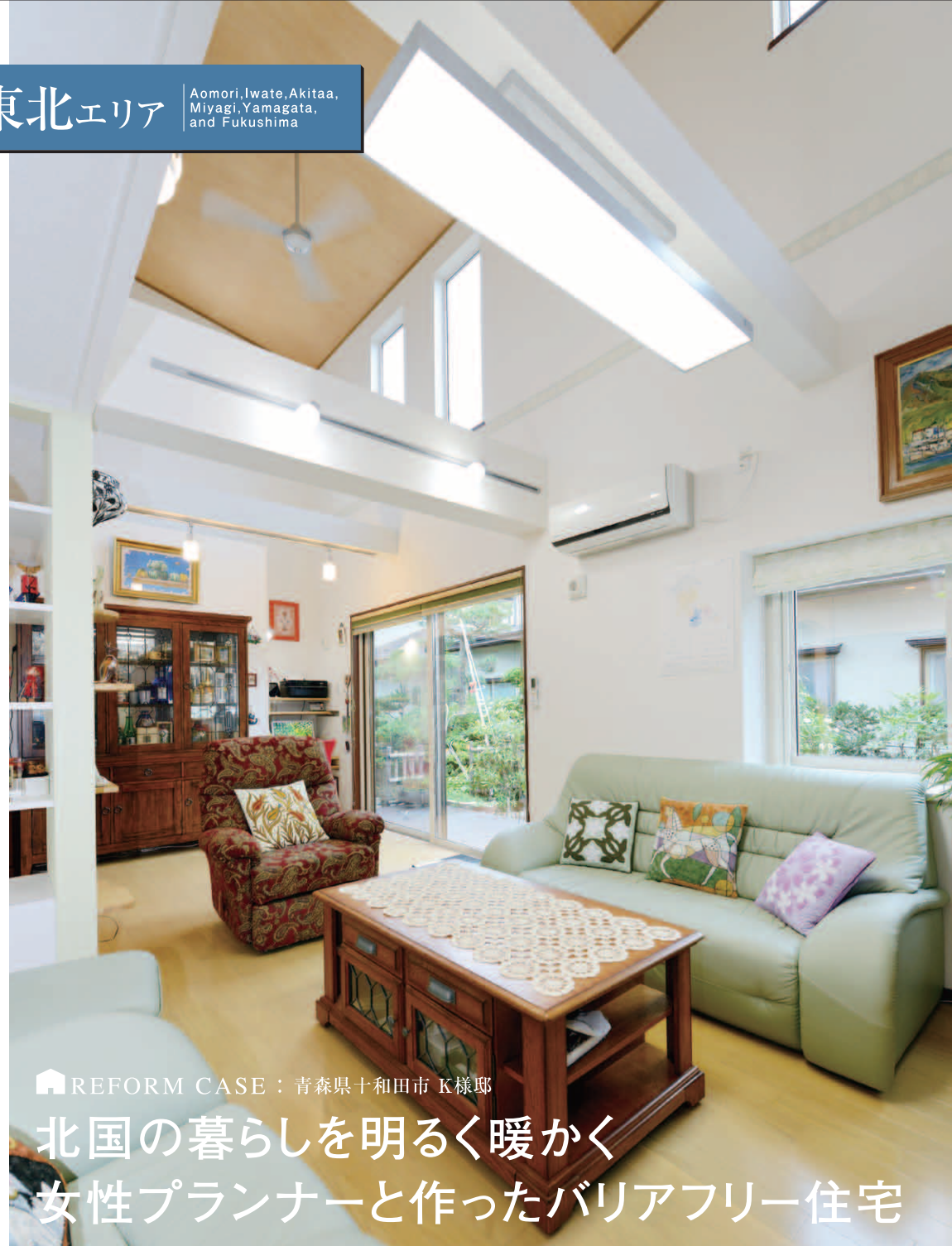
REFORM CASE：青森県十和田市 K様邸