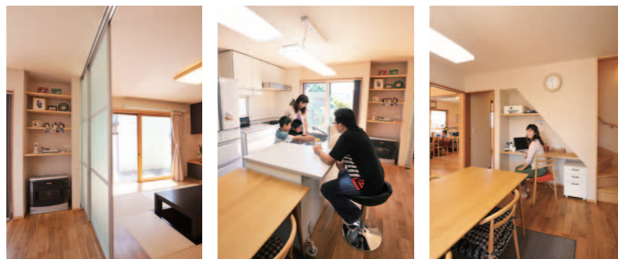
必要ときには間仕切りをすることも出来るので、プライバシーも保たれています