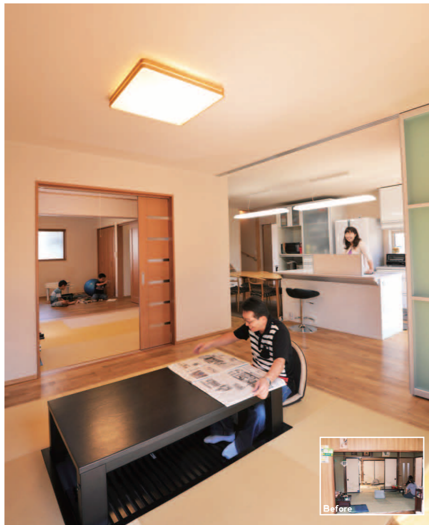
御主人が熱望された掘りごたつ。「冬はもちろん、夏も見栄えが良い。晩酌が楽しみなんです。」とお気に入り