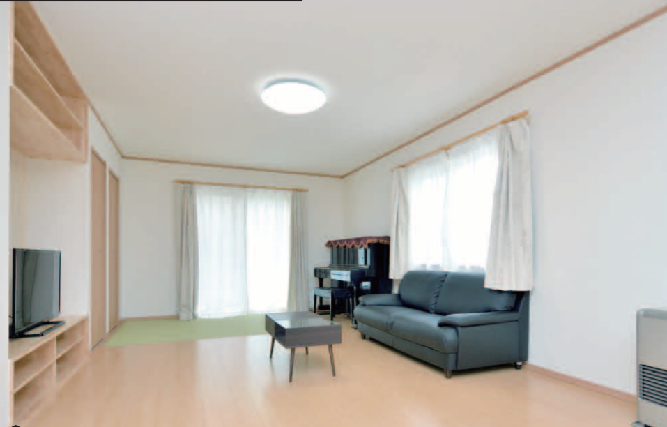
REFORM CASE：青森県八戸市 D様邸